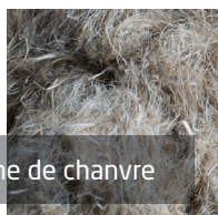
Laine de chanvre